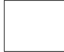
Huella Indice Derecho

Al Señor Director de la Marina Mercante PIDO: Admitir la presente solicitud y previo los trámites corespondientes acceder a lo antes solicitado, para lo cual fundo la presente en los artículos 31 y 83 de la Ley Orgánica de la Marina Mercante, el Convenio Internacional STCW 78 en su forma enmendada del cual Honduras forma parte.